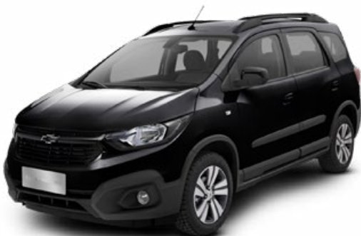
BLACK MEET KETTLE