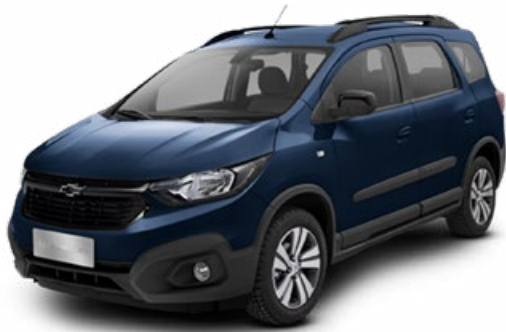
OLD BLUE EYES